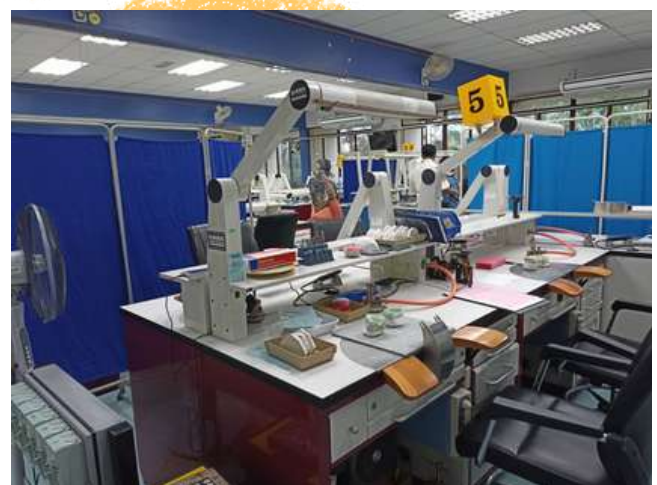
Stesen Ujian Praktikal