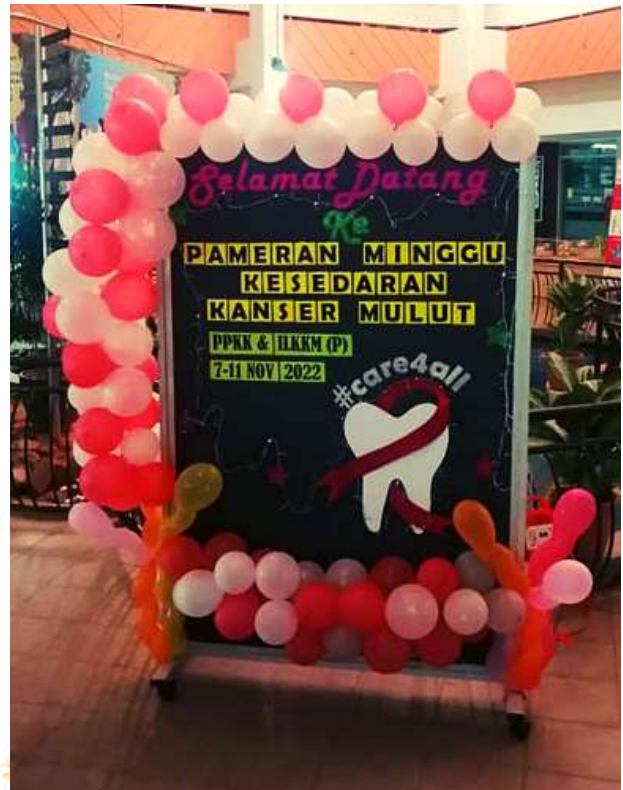
Backdrop MCAW 2022 yang diusahakan oleh Ahli Jawatankuasa MCAW