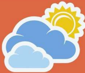
CUACA: PANAS, SEJUK, ANGIN & HUJAN