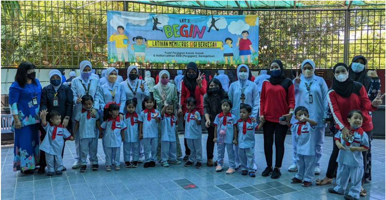
Lawatan Sambil Belajar Kanak - Kanak Taska Mutiara PPKK & ILKKM (Pergigian) Georgetown

Pada 27 Jun 2022, bersempena Hari Kanak - Kanak Antarabangsa 2022, unit Pergigian Pencegahan PPKK & ILKKM (Pergigian) Georgetown telah menganjurkan Lawatan Sambil Belajar Kanak - Kanak dari Taska Mutiara Tulen PPKK & ILKKM (Pergigian) Georgetown.