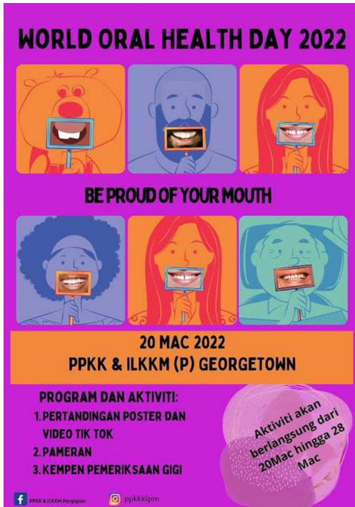
Poster Hebahan WOHD 2022

Sambutan World Oral Health Day (WOHD) 2022 yang bertemakan " Be Proud Of Your Mouth " telah disambut dengan meriah oleh warga PPKK & ILKKM (Pergigian) pada 21 hingga 25 Mac 2022.