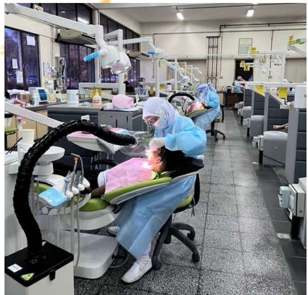
Pengoperasian Latihan di Bilik Rawatan