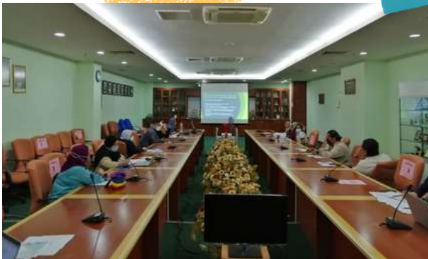
28 Januari 2022 - Bengkel Pengurusan Risiko ISO 9001:2015 Bil 1/2022