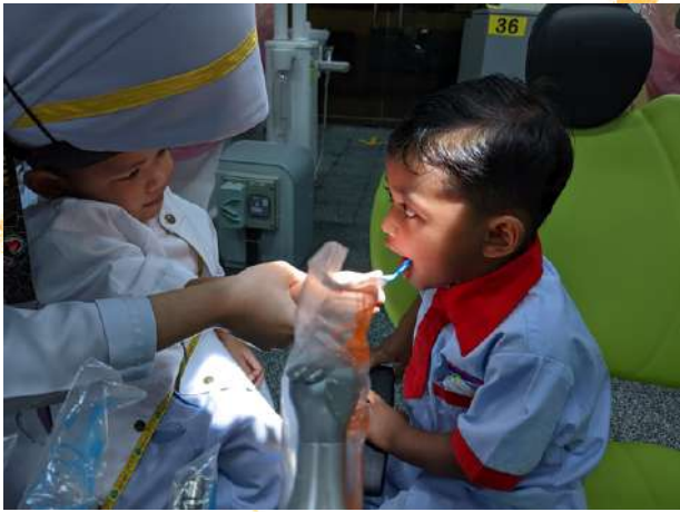
Aktiviti roleplay dan desensitization