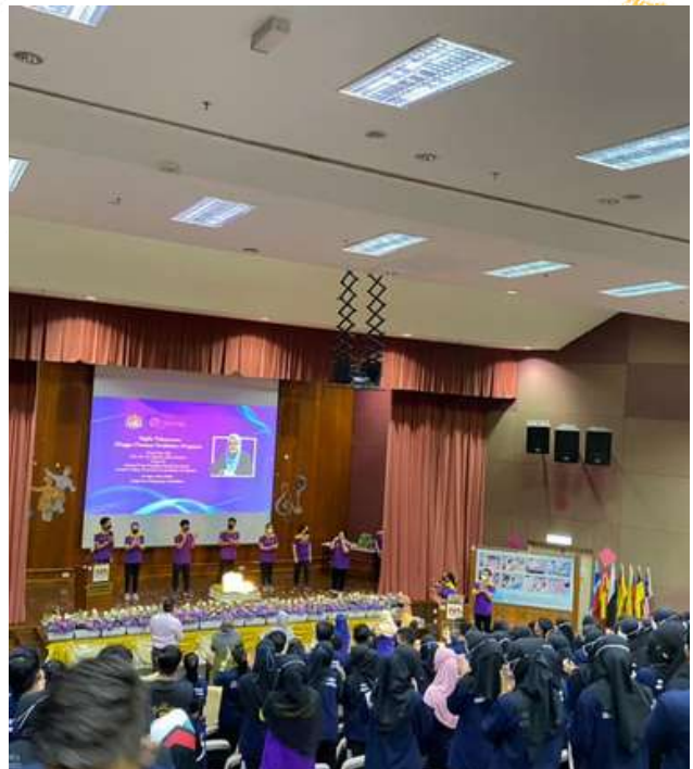
Aktiviti - aktiviti yang dijalankan ketika Majlis Perasmian MPKP 2022