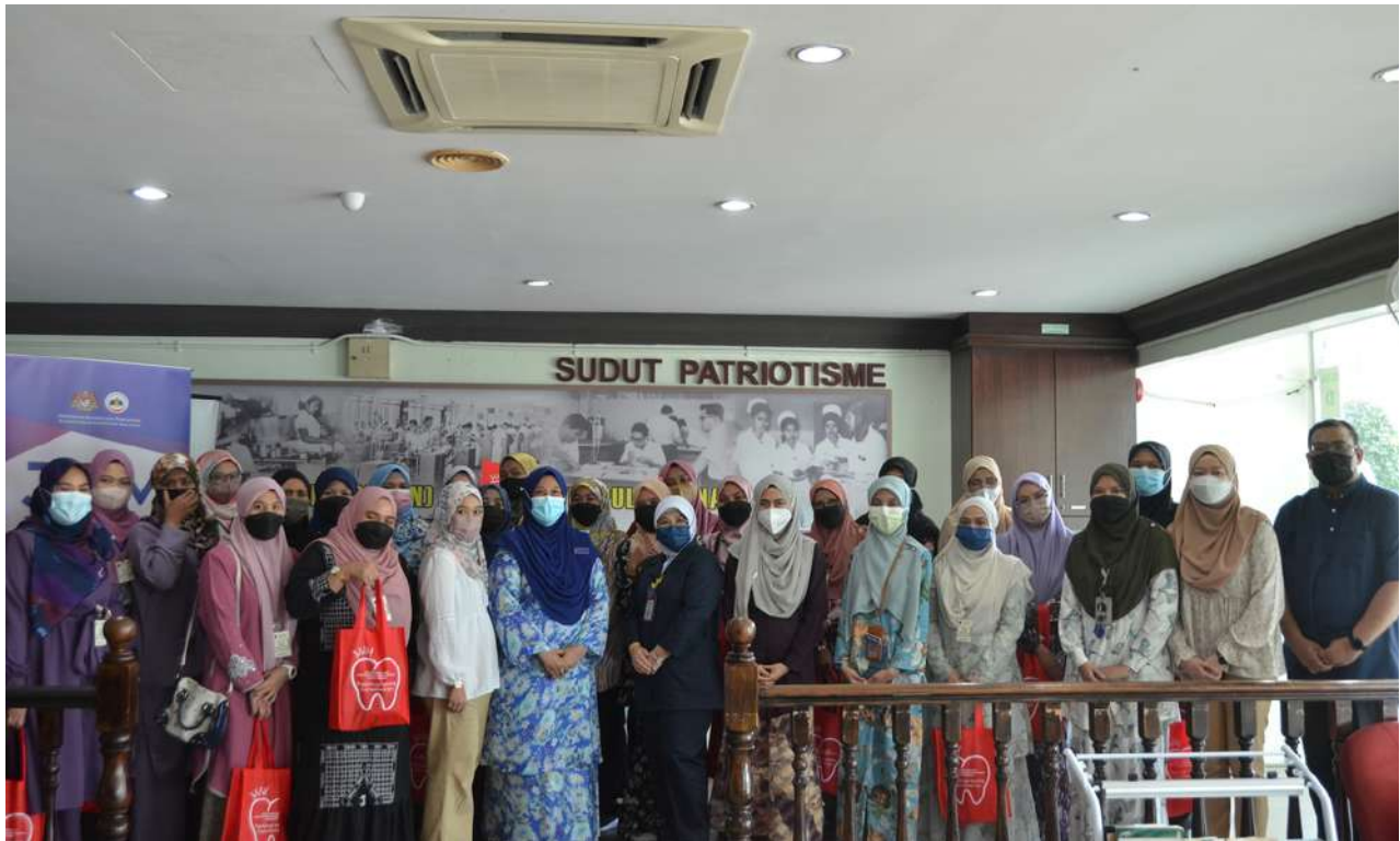
Peserta Bengkel Guru Taska, Tadika & Pra-Sekolah bersama-sama Pengarah dan urusetia program

Bengkel Guru Taska, Tadika & Pra-Sekolah telah diadakan di bawah anjuran Unit Pergigian Pencegahan bersempena Hari Kanak - Kanak Antarabangsa 2022. Tujuan bengkel ini adalah untuk menyampaikan maklumat yang tepat berkaitan kesihatan pergigian kanak - kanak kepada golongan pendidik dan pembimbing taska, tadika dan pra-sekolah. Selain itu, melalui bengkel ini usaha memperkasakan mereka sebagai agen perubahan ke arah mencapai kesihatan pergigian kanak - kanak ke tahap yang lebih baik. Antara maklumat yang disampaikan ialah topik kesihatan pergigian, masalah pergigian serta langkah pencegahan penyakit pergigian dalam kalangan kanak - kanak.