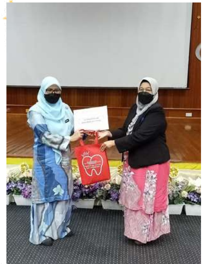
Penyampaian cenderahati tanda penghargaan dari pihak PPKK & ILKMM (Pergigian) Georgetown kepada Pakar Pergigian yang dijemput sebagai pemeriksa