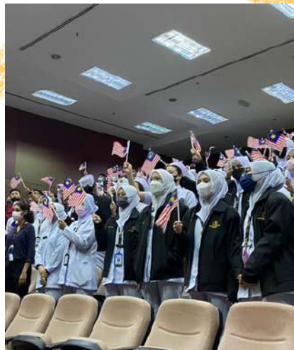
Momen-momen ketika Majlis Pelancaran Hari Kemerdekaan ke-65