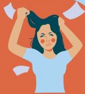
STRESS & PENAT