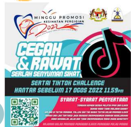
Poster Hebahhan Pertandingan Tik Tok Challenge