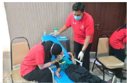
Antara momen sepanjang Program "Senyuman Si Kecil"