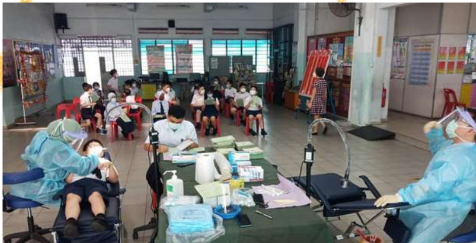
Pasukan Pergigian Bergerak (PPB) PPKK & ILKMM (Pergigian) Georgetown

Perkhidmatan Pergigian Sekolah dilaksanakan secara Pasukan Pergigian Bergerak (PPB) dan secara shuttle ke institusi. Perkhidmatan ini telah meliputi 15 buah sekolah (rendah & menengah) di bawah seliaan PPKK & ILKMM (Pergigian) Georgetown. Pemilihan sekolah untuk Pasukan Pergigian Bergerak dan juga untuk shuttle ke institusi adalah berdasarkan penilaian risiko karies.