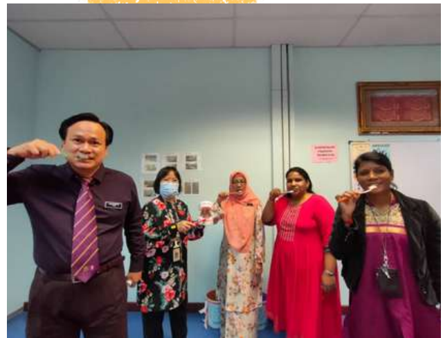
Aktiviti "My Brush Hour" oleh semua staf PPKK & ILKKM (Pergigian) Georgetown