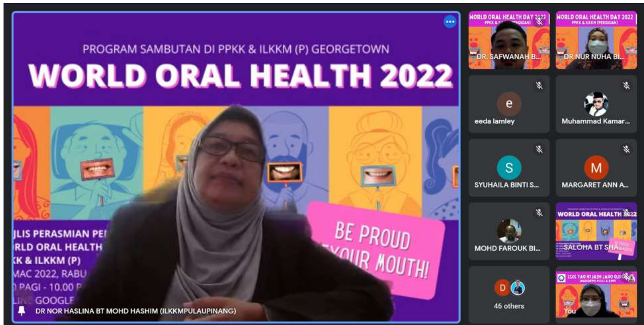
Majlis Perasmian Penutupan World Oral Health Day 2022 dijalankan secara virtual

Semua aktiviti - aktiviti yang telah dijalankan adalah selari dengan kempen Kementerian Kesihatan Pergigian iaitu Kempen Pemeriksaan Gigi Sekali Setahun (PEPS1S). Pihak institusi berharap program ini memberi impak yang besar kepada semua peserta dan orang awam dalam meningkatkan kesedaran untuk terus mengamalkan penjagaan kesihatan pergigian yang optimal.