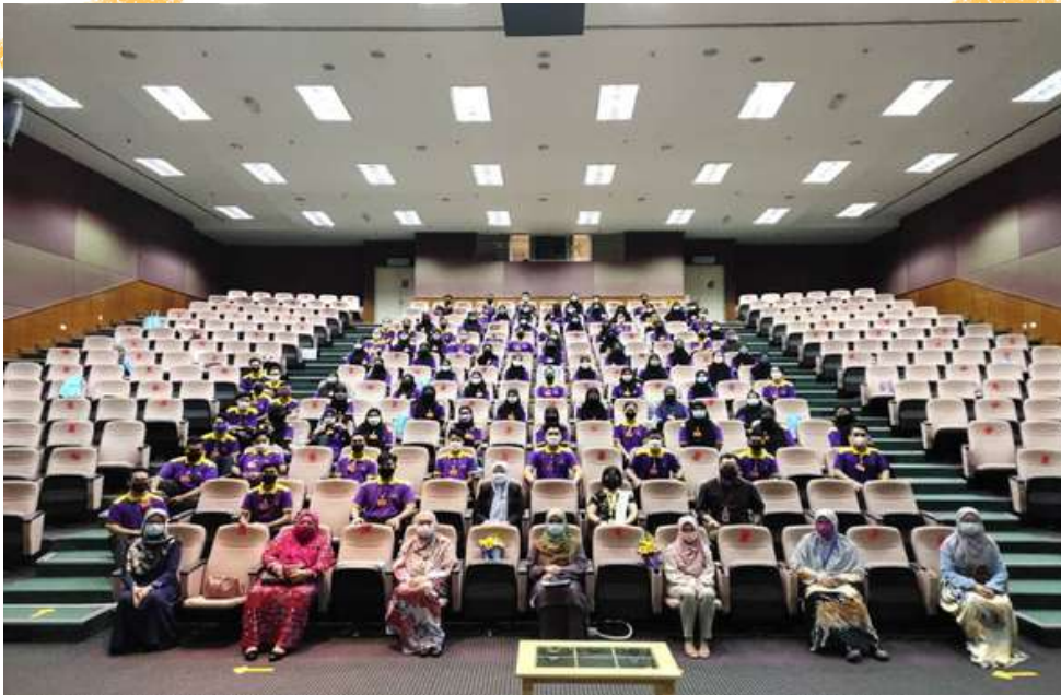
Sesi suai kenal Pengajar bersama Pelatih baharu di Auditorium

Pendaftaran Pelatih Baharu Kursus Pra-Perkhidmatan (Ambilan Januari & Julai 2022)