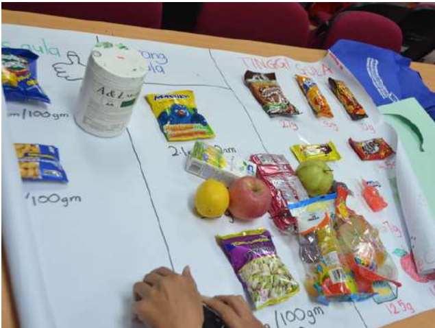
Bengkel Guru Taska, Tadika & Pra-Sekolah telah diadakan di Bilik Unit Pergigian Pencegahan, Bangunan Induk