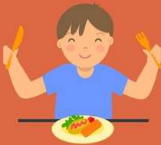
MENGUNYAH, MAKAN & MINUM