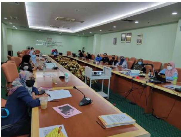
Audit Dalam ISO 9001:2015 Bil 1/2022 pada 28 Mac - 8 April 2022, manakala Bil 2/2022 pada 22 Ogos - 5 September 2022.