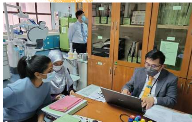
22 - 23 September 2022 - Audit Pemantauan Pertama ISO 9001:2015 oleh CI International Certification Sdn. Bhd.