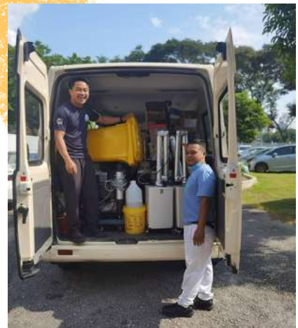
Aktiviti - aktiviti Pasukan Pergigian Bergerakj (PPB) sepanjang menjalani pemeriksaan dan rawatan pergigian di sekolah - sekolah seliaan sepanjang 2022