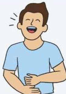
BERCAKAP, SENYUM & KETAWA