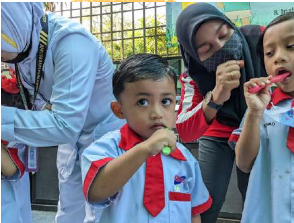
Latihan Memberus Gigi Berkesan (BEGIN)