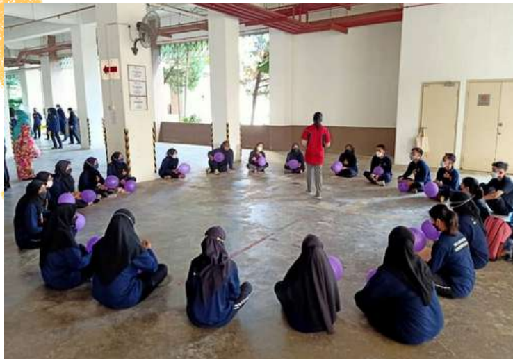
Aktiviti Minggu Orientasi yang diadakan di ruangan parkir Bangunan Tambahan

Pelbagai aktiviti telah dijalankan sepanjang minggu orientasi diadakan bertujuan untuk membantu pelatih menyesuaikan diri di institut dan juga untuk memberi pengenalan kepada etika kerjaya dan tahap disiplin yang diperlukan sebagai seorang bakal penjawat awam. Antara aktiviti-aktiviti yang telah diadakan adalah penyampaian Taklimat Akademik, Taklimat Perpustakaan, Taklimat Keselamatan, Aktiviti Budaya Korporat, Aktiviti Membina Masyarakat dan Ujian Saringan Minda Sihat (DASS).