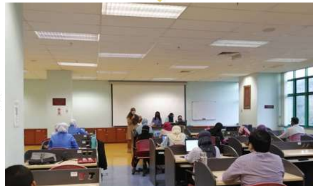
11 - 12 Ogos 2022 - Bengkel Pemurnian Senarai Semak Audit Kualiti Dalam ISO 9001:2015