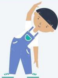
MENYENGET & MEMBENGGOK KEPALA