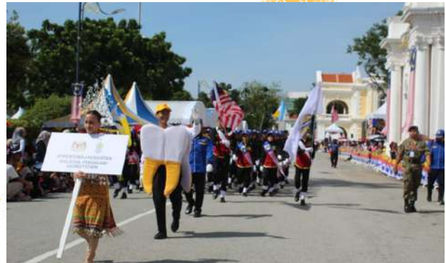
Majlis Perarakan Hari Kebangsaan ke-65 berlangsung di Padang Kota, Georgetown, Pulau Pinang