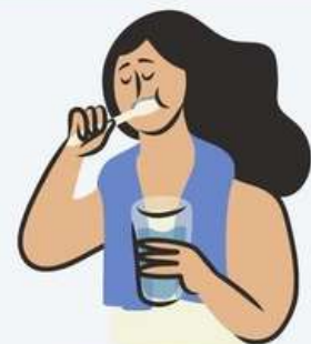
MEMBERUS GIGI & MENCUCI MUKA