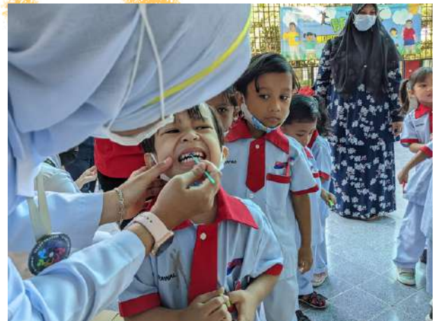
Juruterapi Pergigian menyapu pewarna plak pada gigi kanak - kanak sebelum aktiviti BEGIN dijalankan

Lawatan ini melibatkan seramai 11 orang kanak - kanak toddler dan diiringi seorang guru tadika. Lawatan ini adalah untuk memberikan pendedahan awal kepada kanak - kanak dengan fasiliti perkhidmatan pergigian. Dengan cara ini dapat membantu kanak - kanak menyesuaikan diri dengan persekitaran klinik pergigian.