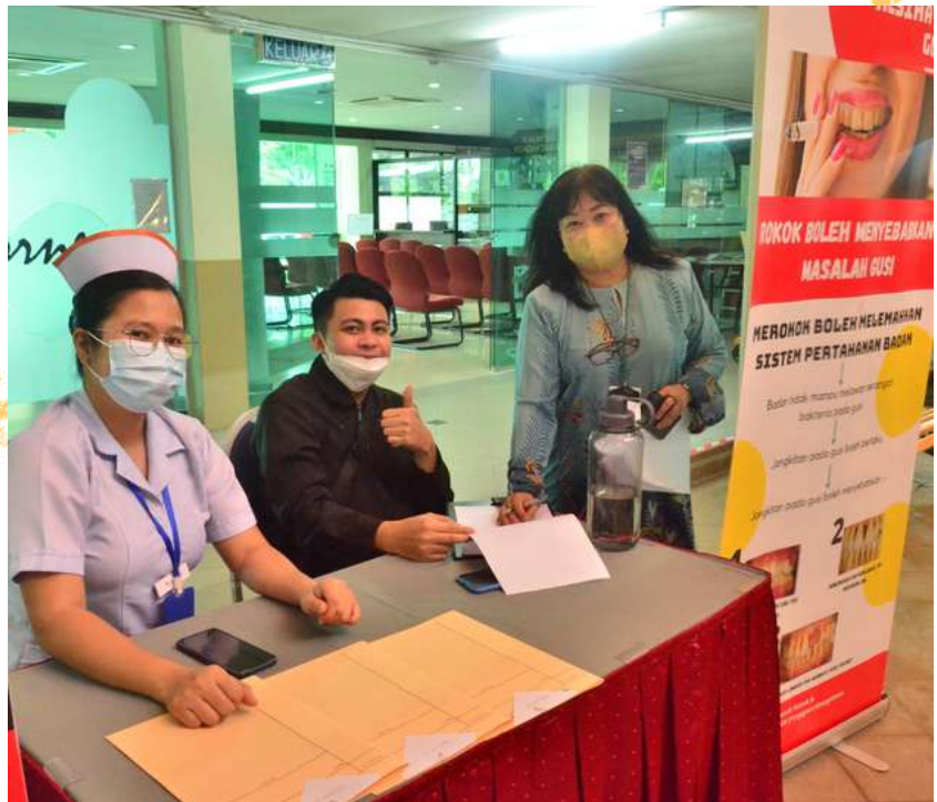
Sekitar Minggu Kesedaran Kanser Mulut 2022 yang berlangsung dari 7 -11 November 2022