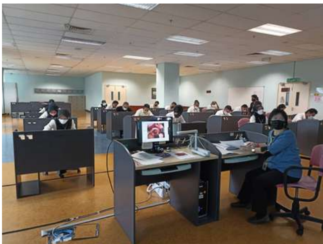
Sesi Ujian Teori