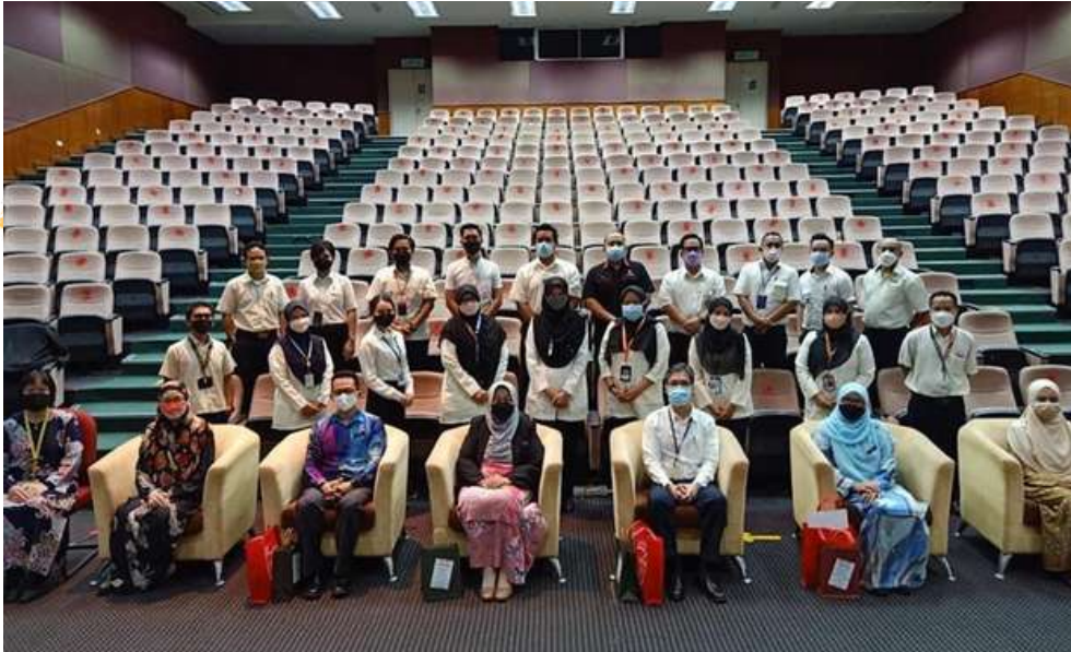
Peserta-peserta Kursus Posbasik Prostesis Maksilofasial bersama Pengarah, Pemeriksa Jemputan, dan Para Pengajar

Seramai 20 orang peserta Kursus Posbasik Prostesis Maksilofasial telah berjaya menduduki peperiksaan akhir mereka pada 7-10 Mac 2022 di PPKK & ILKMM (Pergigian) Georgetown, Pulau Pinang. Usai peperiksaan ini berjalan, maka berakhirnya kursus yang telah berlangsung selama 6 bulan.