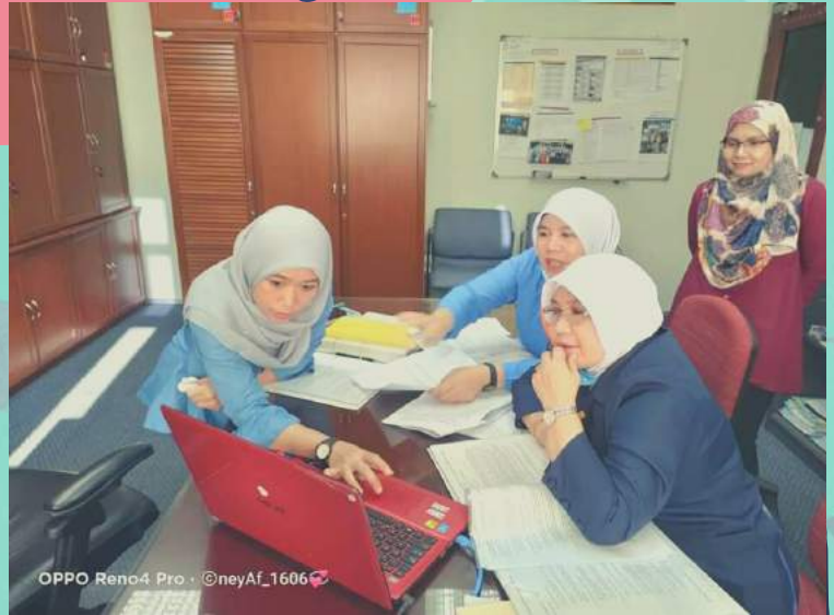
AUDIT PEMANTAUAN KEDUA ISO 9001 - 2015