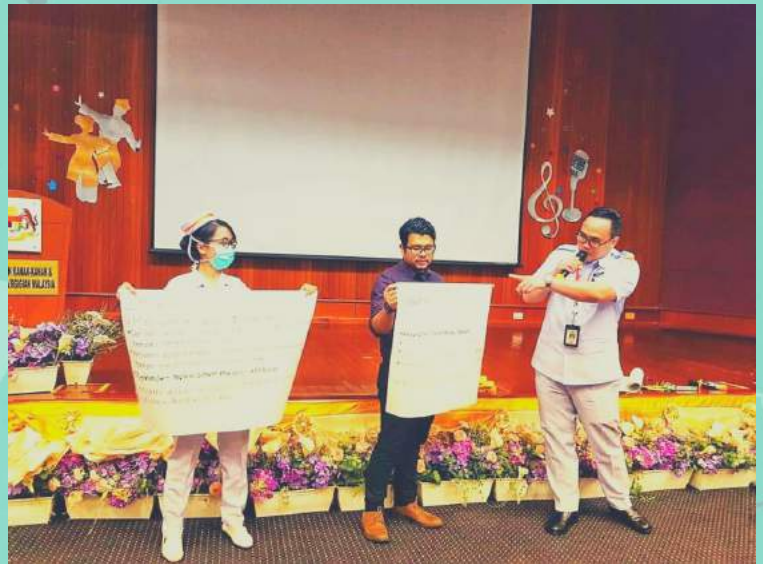
BENGKEL PENGENALAN KEPADA INOVASI PERINGKAT PPKK & ILKKM (P)