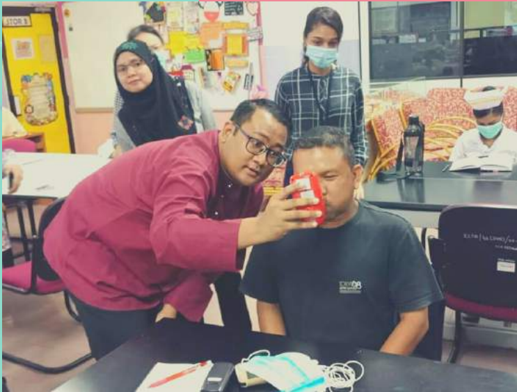
BENGKEL "BREATH CO MONITOR"