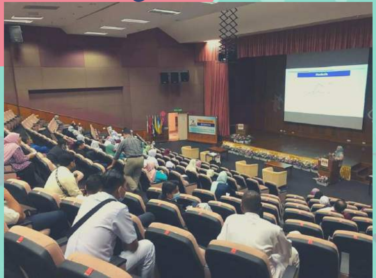
CDE BERTAJUK "FAKE BRACES MANAGEMENT"