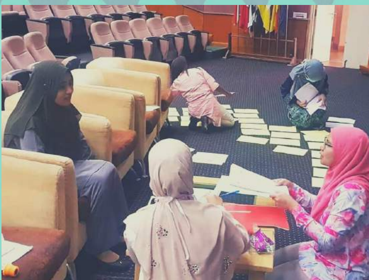
BENKEL KALIBRASI IC DAS