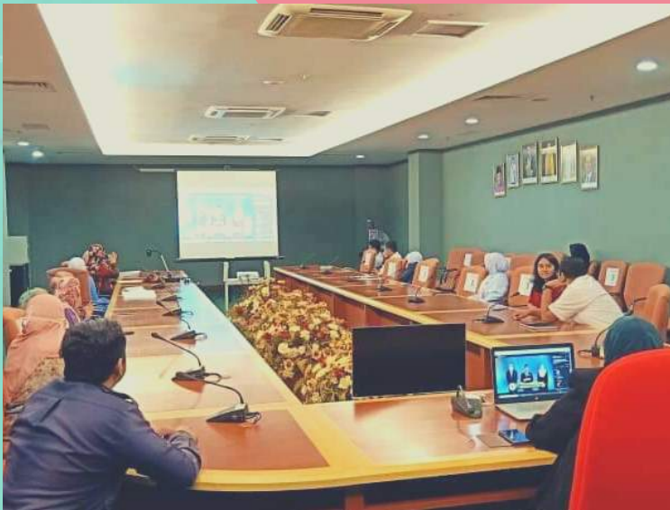
TONTONAN PELANCARAN MINGGU PROMOSI KESIHATAN PERGIGIAN