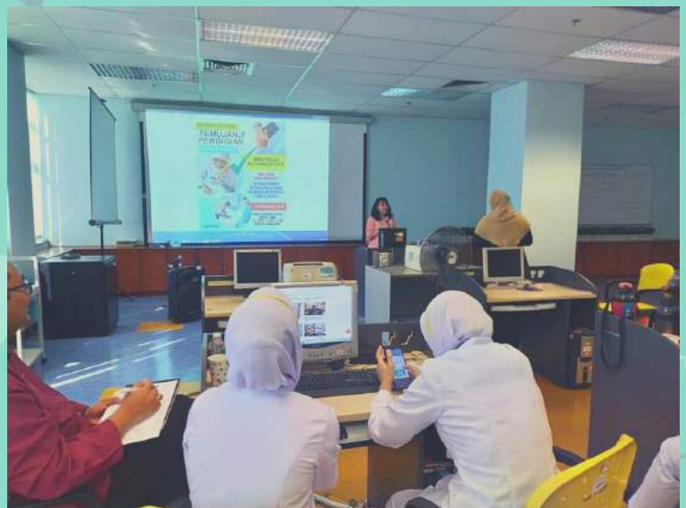
BENKEL FOTOGAFI, INFOGAFIK & VIDEO PENDEK