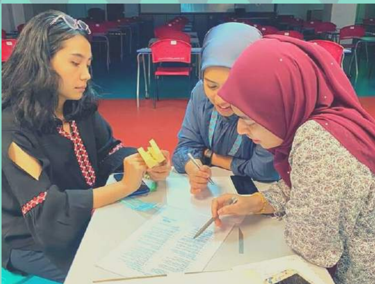
BENGKEL "UPDATES ON IOTN" & ROTOKOL RUJUKAN KES ORTODONTIK